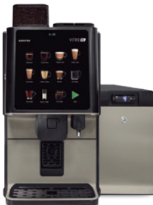
Intelligente Kühlung Temperatursensor Milchstandsensoren

Vitro X1 MIA verfügt über einen 700ccm Boiler und ist damit die perfekte Lösung für Coffee-to-Go-Lokale, Selbstbedienungsläden, Hotels und Tankstellen, die einen unkomplizierten und schnellen Service erfordern. Er ist auch die perfekte Lösung, um zu einem guten Miteinander im Büro beizutragen, mit erstklassigen frische Kaffeegetränke auf Milchbasis und ein Premium-Benutzererlebnis.