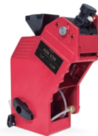
AZK V30 Espresso-Gruppe 7-14 g