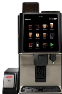
Kit MDB Cashless modul Bereit zur Installation eines Cashless Systems